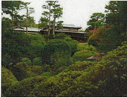
旧陸奥宗光邸 庭園

旧陸奥宗光邸の日本庭園などがご覧になれます。 事前申込み不要ですので、当日に受付して ご入園ください(受付は右下図参照)。