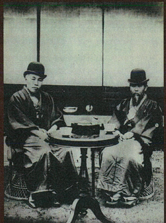
滄浪閣前庭にて 伊藤博文(右)と大隈重信(左)

かつて「明治政界の奥座敷」と言われていた大磯。明治時代から避暑・避寒地として、初代内閣総理大臣の伊藤博文をはじめ、明治政界の要人たちが多くの別荘等々を築きました。今も残されている旧伊藤博文邸「滄浪閣」などの歴史的な建物群や緑地を一体的に保存・活用するため、「明治150年」関連施策として明治記念大磯邸園の整備を進めています。本年は明治改元から満150年にあたることを記念し、一部の区域を公開します。旧大隈重信邸や旧陸奥宗光邸等の庭園の観覧、邸宅のガイドツアーとともに、明治期の立憲政治や各邸宅の人物にゆかりのある資料の展示を行います。